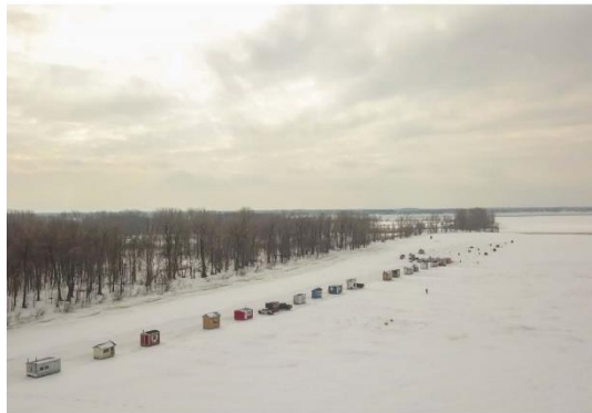
Village de pêche hivernale au Québec.

Le travail de fond du bureau de direction et de l'équipe éditoriale s'est poursuivi en 2020 afin de consolider les processus et méthodes de production, conformément aux bonnes pratiques qui font consensus dans le monde de l'édition scientifique : gestion du virage numérique, révision du calendrier de publication, clarification de certains rôles, rédaction d'un guide à l'intention des réviseurs scientifiques et promotion du nouveau contenu.