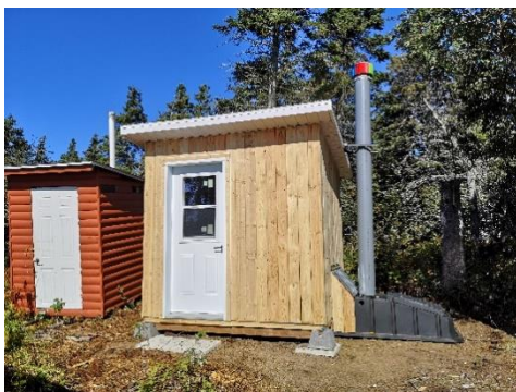
Toilette compost de type Enviroloo.

L'approvisionnement en eau brute des chalets a aussi compté parmi les priorités. Les systèmes de captation des eaux pluviales ont été améliorés. En effet, depuis quelques années, l'île aux Basques présente un approvisionnement déficient en eau brute et un tarissement des eaux récupérées. Afin de pallier à cette problématique, des systèmes de récupération des eaux de pluie et de surface ont été installés. Des réservoirs de 4 500 litres permettront ainsi d'accumuler les quantités d'eau nécessaires pour les besoins de soins corporels et des activités culinaires. Par ailleurs, les systèmes permettront l'accès à une eau filtrée et non tarie, avec un débit régulé.