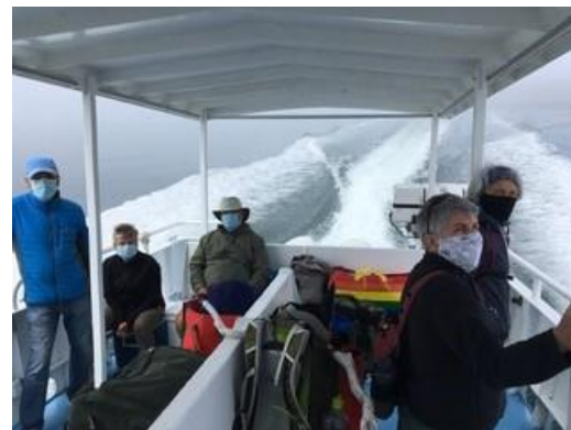
Bénévoles en route pour une corvée vers l'île-aux-Basques.

L'année 2020 a été sans contredit une période chargée durant laquelle la Société a été très active, et ce, grâce à l'engagement des bénévoles et malgré la situation sanitaire causée par la pandémie de coronavirus. Quoique les activités furent limitées, de nombreuses équipes ont œuvré afin d'améliorer et d'assurer la continuité des dossiers et des services rendus à la collectivité. Pensons au nouveau site transactionnel pour la réservation des chalets au parc naturel et historique de l'île aux Basques (PNHIAB) ; à la numérisation du Naturaliste canadien ; aux travaux majeurs de rénovation au PNHIAB; à la construction du pavillon d'accueil, l'installation de nouvelles structures, les nombreux travaux d'entretien à la réserve naturelle du marais Léon-Provancher; au développement d'un nouvel outil pédagogique pour souligner le 200 e anniversaire de la naissance de Léon Provancher : « Léon Provancher : un naturaliste et un curé pas comme les autres... » et à bien d'autres actions, soit scientifiques, soit de financement pour ne nommer que celles-là.