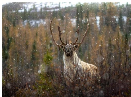
Le Naturaliste canadien. Volume 144, numéro 1, 2020