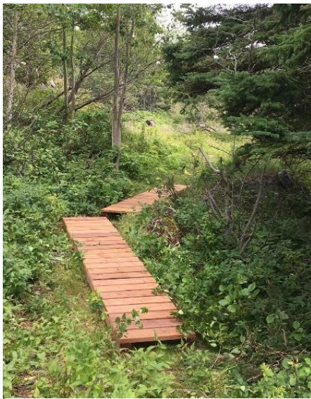
Type de trottoir aménagé dans les sentiers de l'île aux Basques.

L'été 2020 aura également permis de refaire une beauté aux chalets. Des corvées ont permis de rafraîchir la peinture extérieure des murs ainsi que de réparer certaines structures. De plus, les galeries des chalets Joseph-Matte et Rex-Meredith ont fait l'objet de travaux, afin de les rendre conformes au code du bâtiment du Québec en ajoutant des garde-corps.