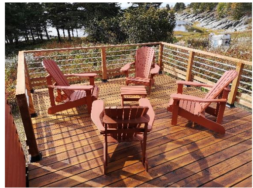
Galerie du chalet Rex-Meredith avec ses nouveaux garde-corps.

Des toilettes dites à terreau (Sun Mar) seront installées dans tous les chalets au printemps 2021. Ce système répond aux exigences réglementaires des autorités municipales et gouvernementales. Il évapore les liquides et composte les solides. La grande majorité des résidus solides sont éliminés et évitent une contamination des eaux souterraines.