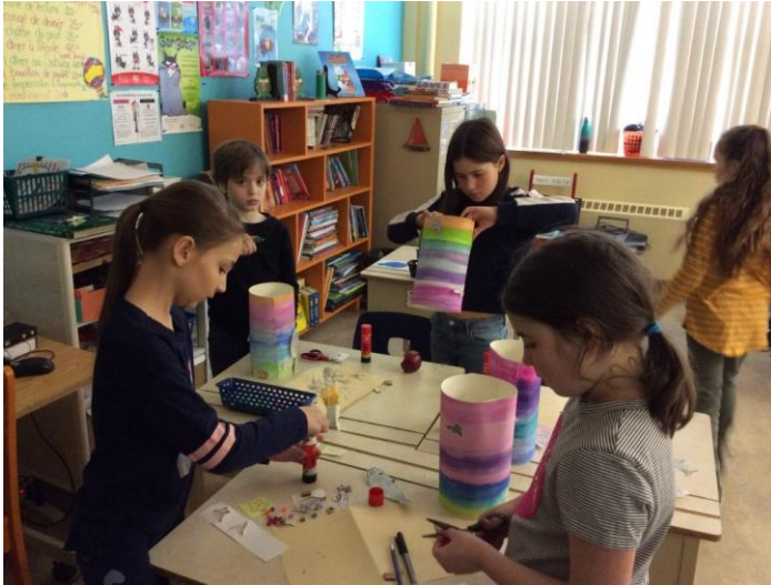
Atelier d'aquarelle à la RNMLP

Huit activités éducatives ont eu lieu en 2020 et elles ont permis de rejoindre plus de 1000 personnes :