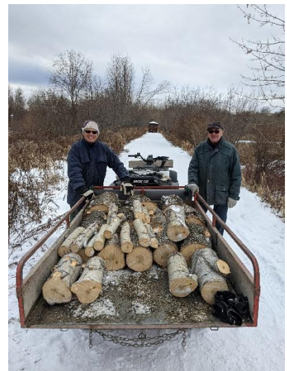
Bénévoles sur la digue à faire du nettoyage.

L'équipe des bénévoles a également veillé de façon quotidienne à la protection et à la mise en valeur du territoire, au respect des règles de la réserve et au respect des nouvelles règles sanitaires par les visiteurs.