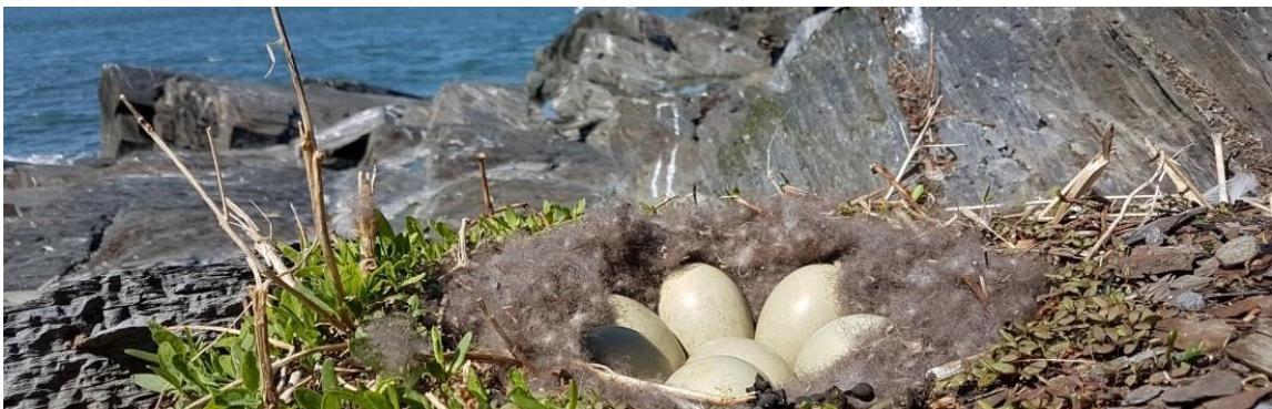
Inventaire des oiseaux marins aux îles Razade par la Société Duvetnor.

Responsables : Réhaume Courtois et René Nault