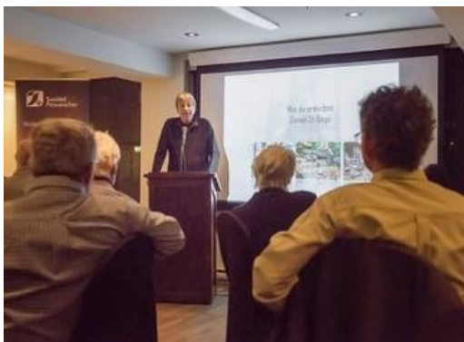
Soirée reconnaissance des bénévoles Février 2020.