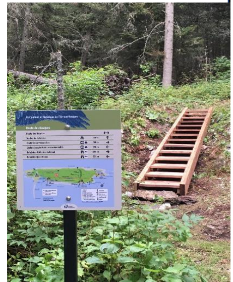
Type d'escalier construit dans les sentiers de l'île aux Basques.

Bien que beaucoup d'efforts aient été fournis à l'été 2020 pour améliorer les infrastructures à l'île aux Basques, le début de la saison printanière de 2021 nécessitera encore des efforts soutenus pour finaliser les travaux entrepris.