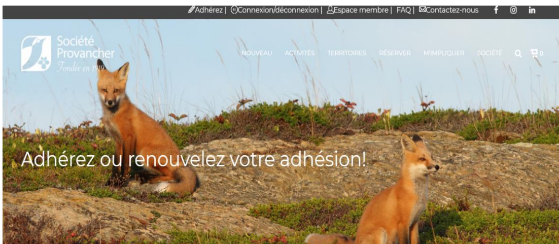
Site Web de la Société Provancher.