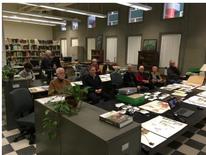
Visite de l'Herbier Louis-Marie, Université Laval.

Le comité des activités éducatives de la Société Provancher existe depuis 2016. Son rôle est d'assumer la responsabilité du programme éducatif en sciences naturelles de la Société Provancher, au moyen d'activités publiques de découverte et de sensibilisation à la protection des habitats et de la faune.