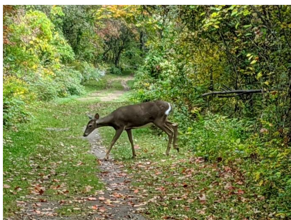
Sur la vieille voies ferrée une biche passe tranquillement.

Un nouveau stationnement était toutefois opérationnel à l'automne pour l'accueil des visiteurs.