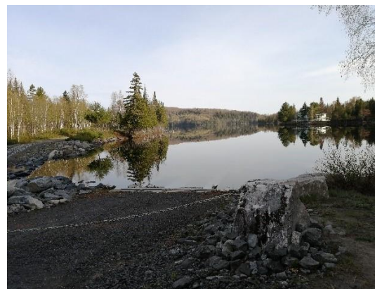
Lac-Clair-de Perthuis.

La réserve naturelle du Lac-Clair-de-Perthuis, sise dans le comté de Portneuf, est un territoire intégralement dédié à la conservation. En 2020, aucune activité destinée au public n'y a été tenue, si ce n'est la surveillance du territoire pour prévenir les activités qui pourraient affecter son intégrité. Une demande d'aménagement d'un sentier a été faite par les résidents du secteur. La Société évaluera la faisabilité d'un plan de conservation en 2021, avant d'autoriser cette démarche.