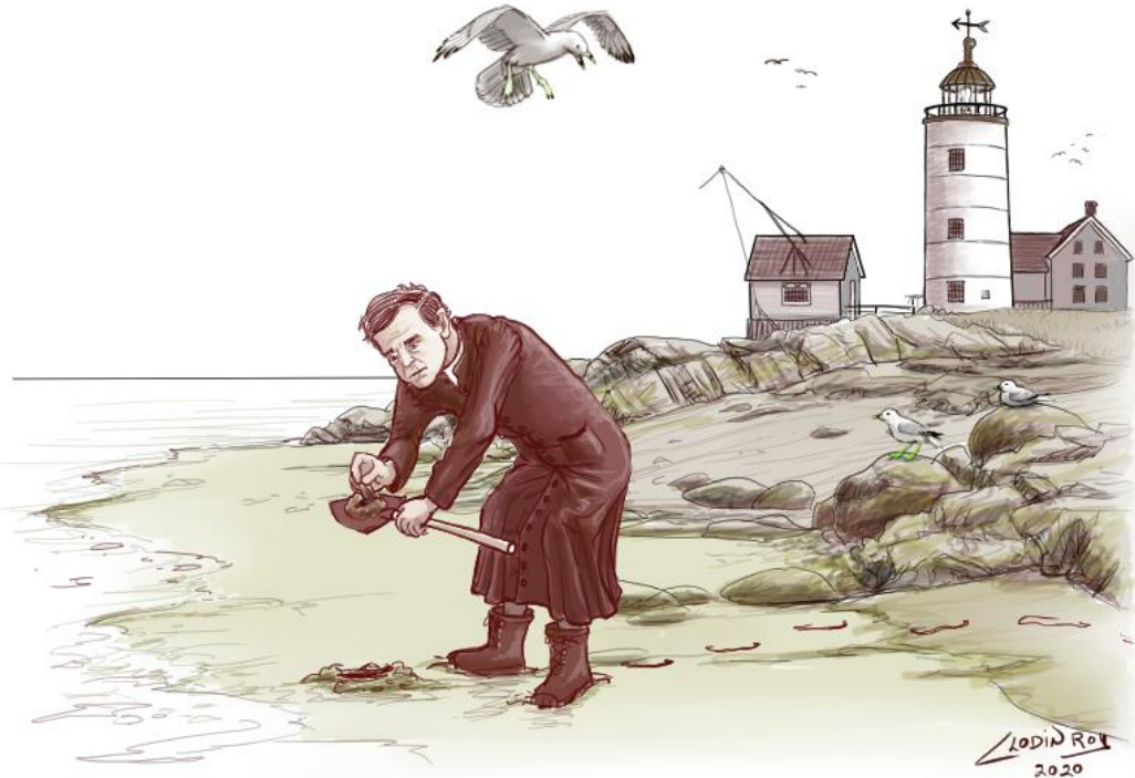
Ornithologie et mollusques : dessin de Clodin Roy en lien avec le 200 e de la naissance de Léon Provancher